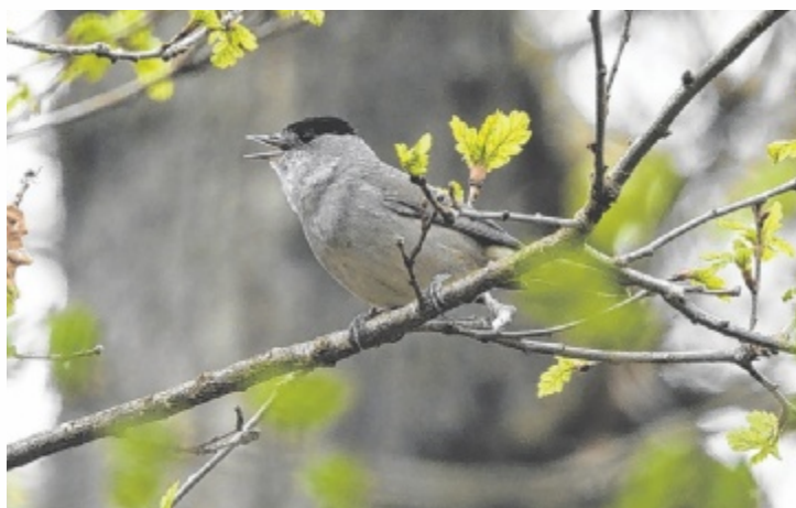
Ein Mönchsgrasmücke Männchen im Raader Wald

sie ihrem Köppchen zu verdanken. Das Männchen ziert ein schwarzes, das Weibchen zieht ein unauffälligeres braunes vor. Apropos Mönch, früher waren Geistliche und Lehrer die geistigen Kapazitäten und Meinungsbildner, die so nebenbei auch die Tier- und Pflanzenwelt erforschten. Heutzutage traut sich fast niemand mehr eine öffentliche Meinung zu haben, es braucht wieder mehr „Mönchsgrasmücken“, sprich kluge Köpfe, die ihre Stimme klar und deutlich zu gesellschaftlichen Vorgängen erheben. Auch die Natur braucht jede weise Stimme. ■