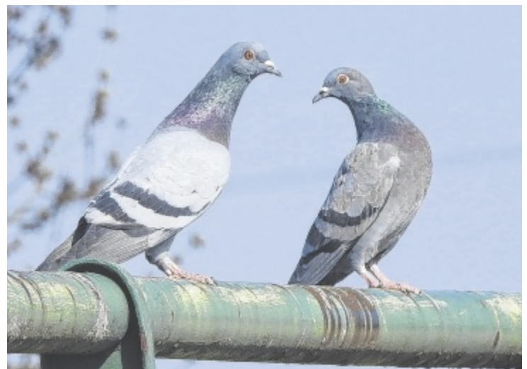
Die Straßentaube als Zeichen für Liebe und Frieden

http://www.literaturhaus.at/index.php?id=12146 http://www.cobi.at/magazin/magazin